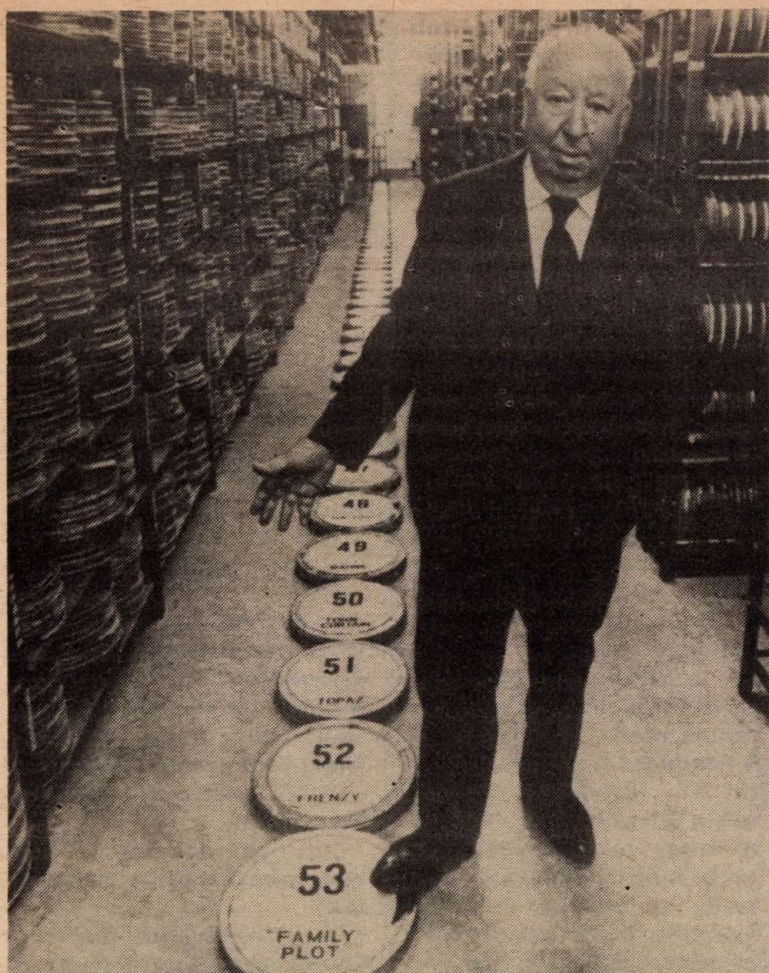
Egy 53 filmes rendező