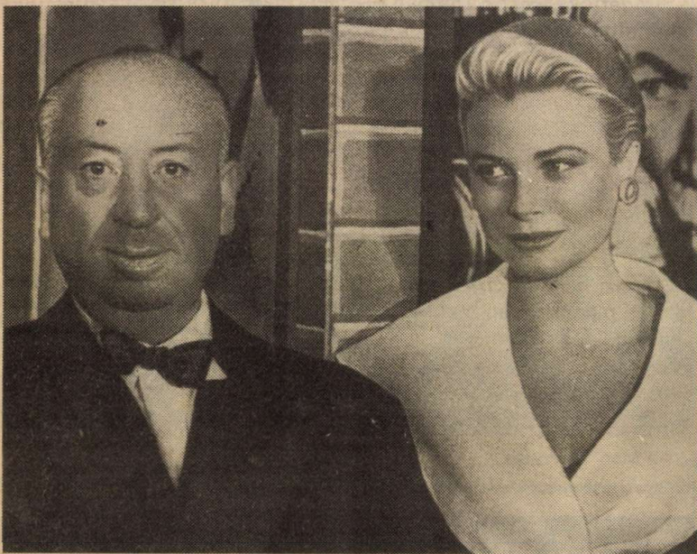
Hitch Grace Kellyvel

biggyesztett. A címek után a párbeszéddek, a párbeszéddek után a forgatókönyvek következtek, majd pedig a rendezés, először segédrendezőként.