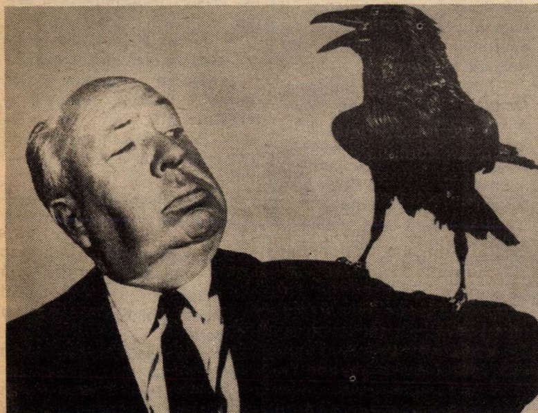
Hitch – egy szereplővel a Madarak-ból

A lfred Hitchcock 1980 áprilisának végén halt meg. 81. évében járt.