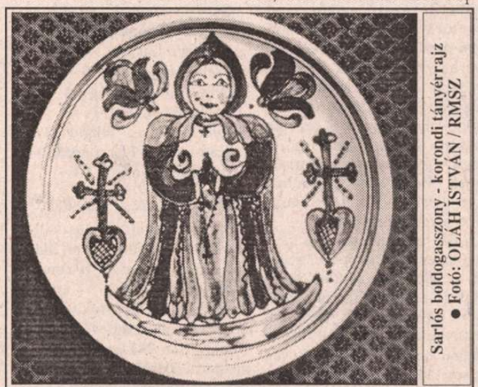
Sarlós boldogasszony - korondi tányérrajz

A Los Angeles-i földalatti bírálói azzal érvelnek, hogy ez a város szalagfalvakból nőtte ki magát decentralizált szövevényre a személygépkocsi-használatnak köszönhetően, és lakosai soha nem lesznek hajlandók a földalattit életképes közlekedési alternatívaként elfogadni.