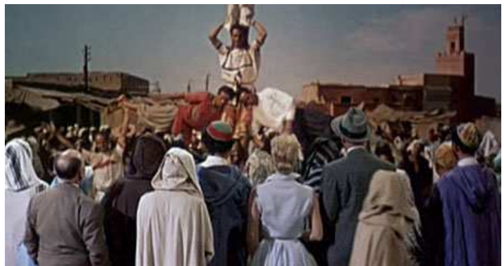
6. sz. melléklet : A férfi, aki túl sokat tudott egyik kulcsfontosságú jelenete előtt (balra Hitchcock)