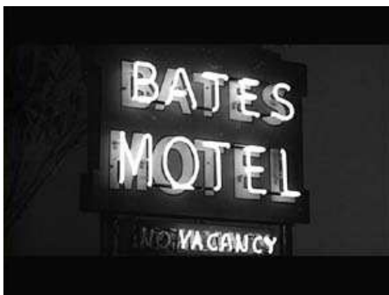
5. kép: A Psycho című thrillerből a rejtélyes Bates Motel neonfelirata

( http://www.port.hu/pls/fi/films.film_page?i_film_id=86436&i_city_id=3372&i_county_id=1&i_where=2 )