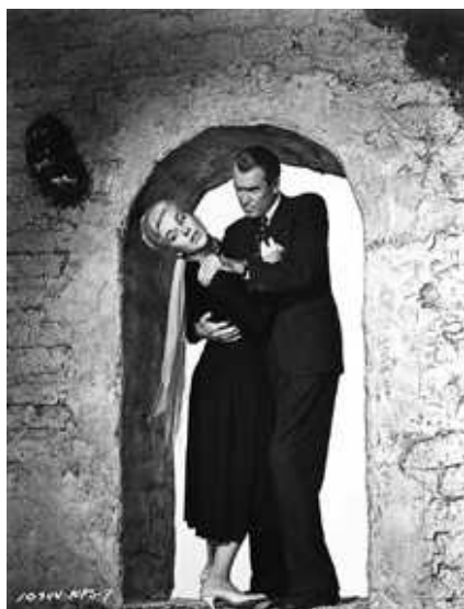
15. sz. melléklet: A Szédülés című film két főszereplője: Kim Novak és James Stewart.