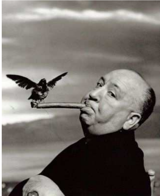
4. sz. melléklet: Alfred Hitchcock, a filmek „mestere”