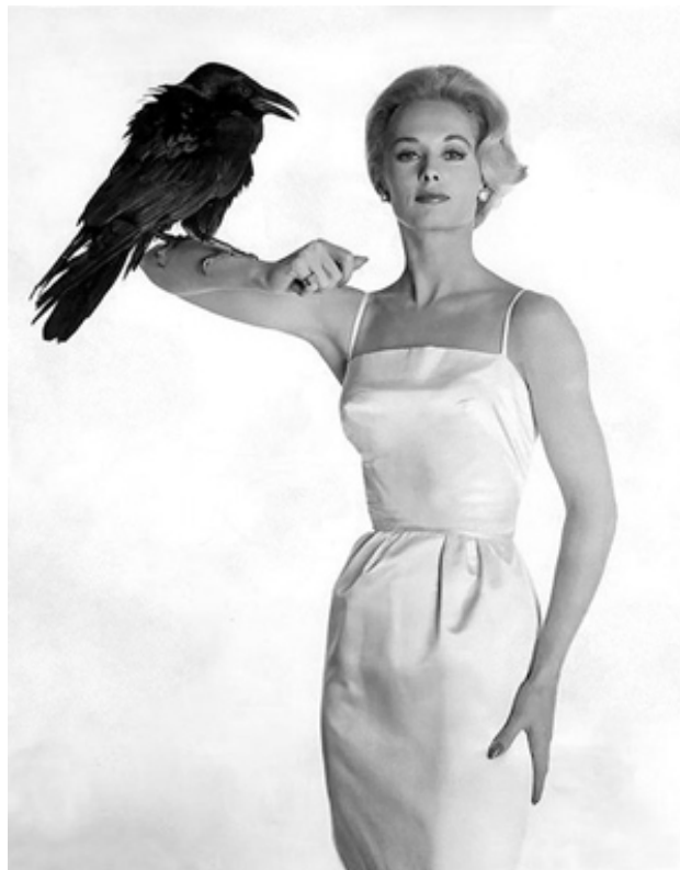
20. sz. melléklet: A Madarak című filmhez készült reklámfotó, melyen Tippi Hedren látható.