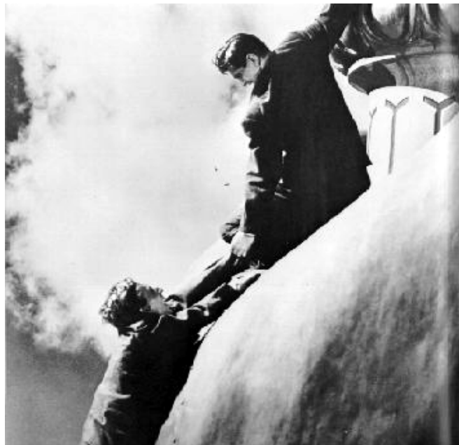
10. sz. melléklet: A Szabotőr című film egyik híres jelenete, amely a New-York-i Szabadság-szobor tetején játszódik.