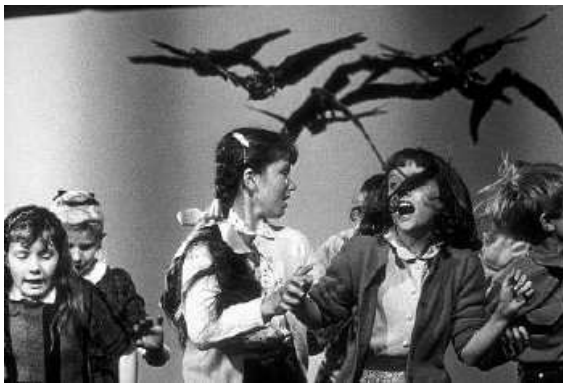
3. kép: A Madarak című filmben megvadulnak a szárnyasok

A '70-es években nagy divat volt horrort és thrillert rendezni. Csak, hogy néhány filmet említsek: Ördögüző, Ragyogás, A texasi láncfűrészgyilkos, és persze a híres és borzongató Ómen. Az utóbbi film első része Hitchcock egykori színészével, Gregory Peckkel a főszerepben készült. A második rész a Madarak című filmet idézi, mikor a kamasz Damien – aki egyben az antikrisztus is – hollói lecsapnak áldozatukra, hogy megvédjék a fiút (3. és 4. kép). A zene a filmben ugyanolyan kísérteties, mint Hitchcock alkotásaiban. Sir Alfrednek is voltak vallási témájú krimije, ilyen volt a fentiekben említett Meggyónom és a Tévedés című film is.