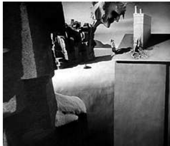
2. kép: A Bűvölet című filmből az álomjelenet, melyet Dalí tervezett (2)

Hitchcockkal kapcsolatban eléggé megosztott volt a vélemény a színészek körében. Többen nem kedvelték a humora miatt, sokszor túl nyersnek találták. A másik dolog, amit nem kedveltek benne, hogy a forgatásokon nem adott sűrűn tanácsokat, nem dicsérte őket. Ebből adódóan sokan gondolták, hogy nem tetszik neki a munkájuk. Pedig ez nem így volt. Ha nem tetszett neki valami, azt megmondta, de feleslegesen nem kommentált semmit. Ha nem szólt, az azt jelentette, hogy minden rendben van. Voltak színészek, akiket nem nagyon