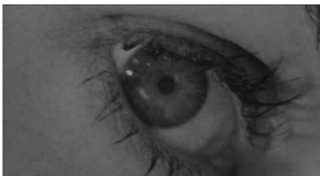
10. kép: A Psycho című filmből Marion szeme superplánban

Sir Alfred sokat játszott ezekkel a beállításokkal, gondoljunk csak a közismert Psycho-ra, ahol a meggyilkolt Marion szemét mutatja sokáig a kamera (10. kép), majd folyamatosan távolodik tőle.