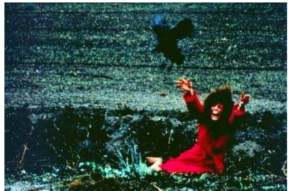
4. kép: Richard Donner Ómen című alkotásában támad egy holló, akár a Madarakban

A '90-es évek végén készült egy német filmdráma, A lé meg a Lola, mely néhány pontján hasonlít a Szédülés című filmre. A történet szerint egy autókereskedésben pénzbehajtóként dolgozó férfi szem elől téveszti a pénzt, amit rábíztak. Ha nem tudja időben visszaszerezni a pénzt, akkor meghal. Ahhoz, hogy megkeresse, barátnője segítségét is kéri. A rendező, Tom Tykwer bevallotta, hogy egyik kedvenc filmje a Szédülés, és pár ötletet is áthelyezett belőle ebbe a filmbe. A német filmben szerepel egy kép, ami egy nőt ábrázol szőke konttyal. Úgy néz ki, mint Kim Novak a Szédülésben, illetve mint az a festmény, amit Novak néz a múzeumban. Ráadásul a két film tér-, és időszerkezete is nagyon hasonló.