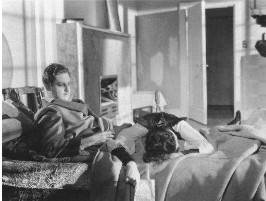
7. sz. melléklet: A bonyodalom kezdete a 39 lépcsőfok című krimiben. (A képen: Robert Donat és Lucie Mannheim)