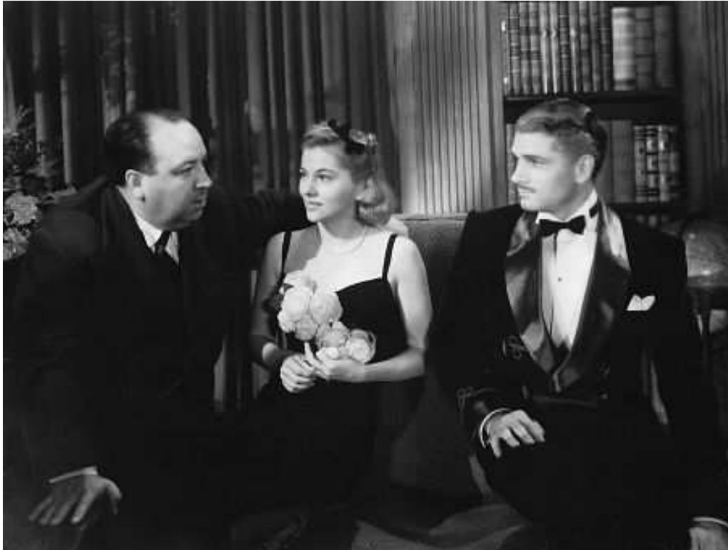
9. sz. melléklet: Forgatási szünet a Manderley-ház asszonya című film felvételei közben (balról: Alfred Hitchcock, Joan Fontaine és Laurence Olivier)