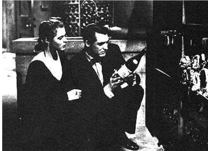
7. kép: MacGuffin a Forgószélben

A mai filmek közül az Indiana Jones, Az elveszett ereklyék fosztogatói, Mission: Impossible és a James Bond sorozat az, amiben nagy szerepe van a MacGuffinnak. A pozitív főhősnek kell egy bizonyos tárgyat, személyt vagy informácót megszereznie a negatív szereplők elől.