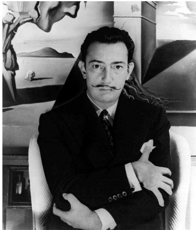
12. sz. melléklet: Salvador Dalí, spanyol festőművész, aki segítséget nyújtott a Bűvölet című krimihez. Forrás: http://www.tate.org.uk/modern/exhibitions/daliandfilm/default.shtm