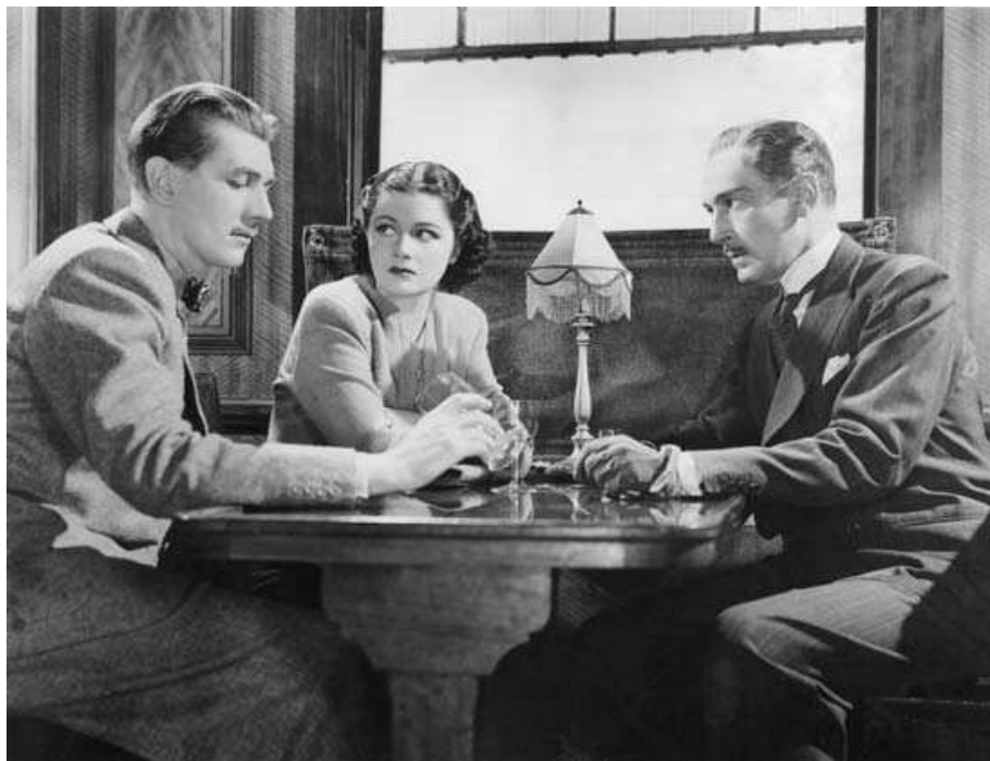
8. sz. melléklet: A Londoni randevú egyik jelenete (balról: Michael Redgrave, Margaret Leighton és Paul Lukas) Forrás:

http://www.britannica.com/eb/art-92301/Margaret-Lockwood-with-Michael-Redgrave-and-Paul-Lukas-in-The