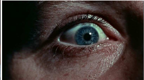
8. kép: Voyeurizmus Hitchcock klasszikusában, a Hátsó ablakban 9. kép: Voyeurizmus Michael Powell filmjében, a Peeping Tomban

Ferzan Özpetek, török származású olasz rendező 2003-as filmjének középpontjában egy férjes asszony áll, aki a lakásuk ablakán keresztül figyeli a szemközt lakó jóképű szomszédjukat. Mivel a nő már nehezen viseli a szürke hétköznapiakat, és a férjét is túl szelídnek, nyugodtnak és unalmasnak találja, egy idő után a számára még idegen embert tartja ideális férfinak. A filmben nem csak ezen van a hangsúly, hanem a különböző emberi kapcsolatokon és az élet értelmén. Nagyon szép film, ami az emberi értékekről szól.