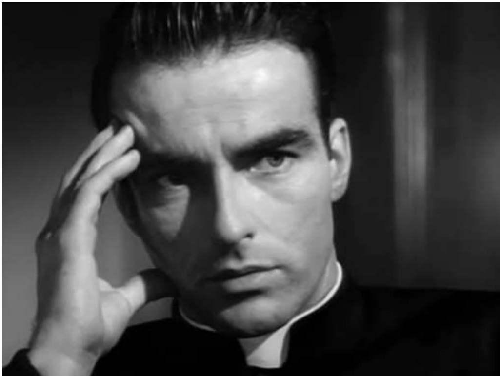
14. sz. melléklet: Montgomery Clift, a Meggyónom című krimi bajba keveredett papjaként.