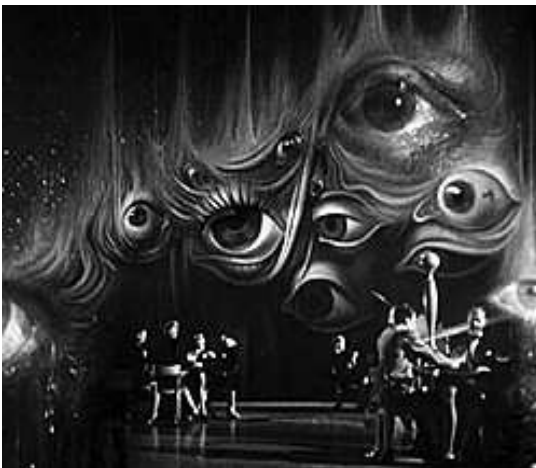
1. kép: A Bűvölet című filmből az álomjelenet, melyet Dalí tervezett (1)

A filmgéniusz 1945-ös alkotása a Bűvölet Gregory Peck és Ingrid Bergman főszereplésével készült el. David Selznick, Hitchcock mozijának prodecere szerette volna, ha a rendező egy pszichiátriáról forgat filmet. A Bűvölet ben egy doktornő beleszeret egy új orvosba, azonban a férfiről kiderül, hogy ő nem az az ember akinek kiadja magát, sőt lehet, hogy gyilkos is. A doktornő meg akarja menteni, pszichoanalízisnek veti alá az orvost, megpróbálja megfejteni az álmait. Hitchcock nem akarta a szokásos, homályos felvétellel ábrázolni a férfi álmát, ezért az álomjelenetet a híres spanyol festőre, Salvador Dalíra bízta (12. sz. melléklet). Igazából ez a jelenet tette nagyon különlegessé ezt a filmet. Mai szemmel kezdetlegesnek tűnhet, de az akkori filmezésben ez újdonságnak számított. A jelenetben ollóval szétvágott szemeket, és Dalítól megszokott szürrealista motívumokat láthatunk (1. és 2. kép). A spanyol művésznek több ötlete is volt, de nem kerülhettek bele a Bűvölet be, részben anyagi okok miatt. Külön érdekesség, hogy az alkotás zeneszerzője, a magyar származású Rózsa Miklós ezért a munkájáért Oscar-díjat kapott.