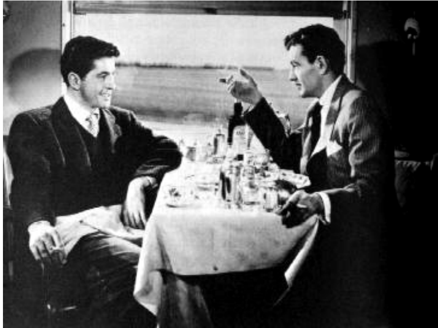
13. sz. melléklet: A közismert jelenet az Idegnek a vonaton című klasszikusból.