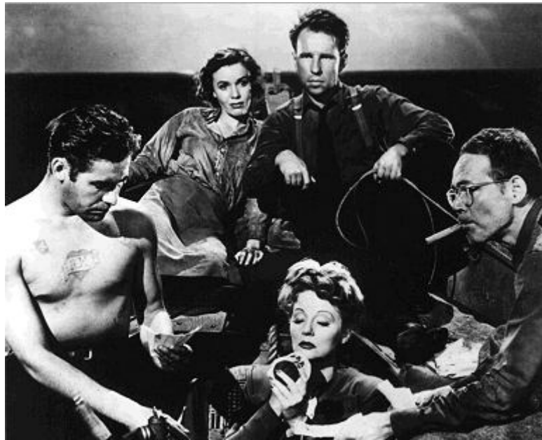
11. sz. melléklet: A Mentőcsónak című film főszereplői.