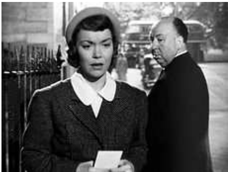
5. sz. melléklet: Hitchcock cameo szerepben a Rémület a színpadon c. filmben.