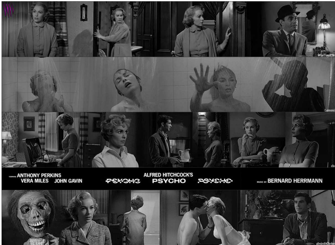
19. sz. melléklet: A Psycho különböző jelenetei.