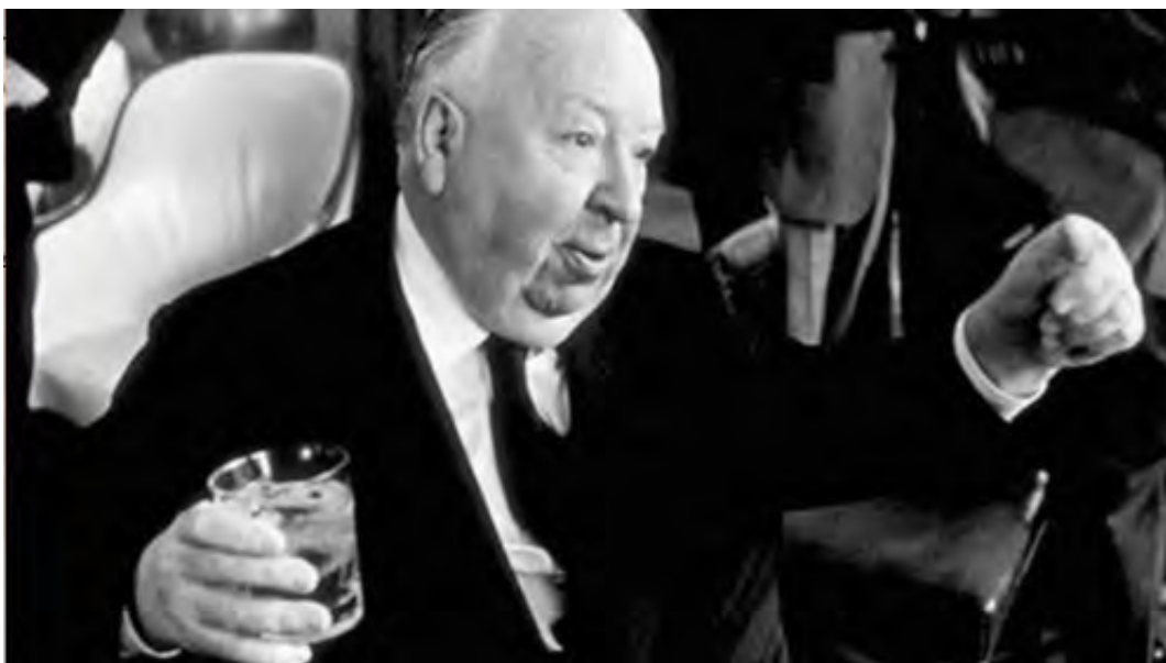
A mester, Alfred Hitchcock

Žižek tanulmányának egyik gondolatát fejti ki Mladen Dolar, aki a kötet egyik legizgalmasabb tanulmányában Hitchcock tárgyainak megjelenési módjait, értelmezési lehetőségeit és rendszerezését vázolja fel. A Dolar által felvázolt rendszerben kitér a híres McGuffin meghatározására és működés módjára is, nem utolsósorban pedig megtudjuk azt is, hogy az elnevezés alapja egy vicc: „Mi van abban a csomagban, amit a csomagtartóba raktál? Az egy McGuffin. Mi az a McGuffin? Hát az egy szerkentyű, amivel oroszlánt lehet fogni az Adirondak hegyen. De hát az Adirondakban nincs is oroszlán. Poén A: Valójában ez sem egy McGuffin. Poén B: Látod, működik.”