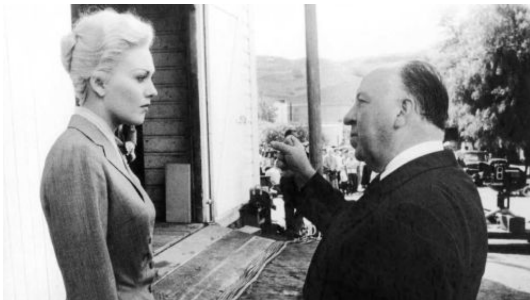
Kim Novak és Alfred Hitchcock aVertigo forgatásán

Hogy akkor mi is az a valami, arra lehetetlen felelni: Lacan szóhasználatával élve talán ez az a „Dolog”, melyet az elmúlt 80 évben tengernyi szakavatott és amatőr „kódfejtő” igyekezett körüljárni, és így tesz az Apertúra Könyvek első kötetének nagy tekintélyű szerzőgárdája is.