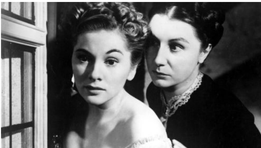
Rebecca, a Manderlay-ház asszonya

Egy komoly szakszöveget felvonultató könyv kapcsán ritkán adatik meg az olvasónak, hogy ne csak a tartalomban, hanem a külcsínben is esztétikai élvezetet leljen. Ám ezt a kötetet már csak nézegetni is érdemes. A borító már-már provokatív minimalizmusa Hitchcockhoz méltó hatást kelt, és szinte azonnal magához vonzza a tekintetet. A kötet pszichoanalitikus elemzése révén később még arra is vetemedhetünk, hogy messze menő következtetéseket vonjunk le abból, ahogy a cím köré gyűlnek a hírhedten baljóslatú madarak— mintha csak arra várnának, hogy keselyűkként cincálják szét a könyv tárgyát, a „kisbetűsített” hitchcockot.